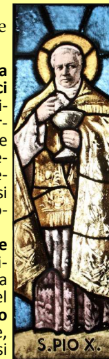
S. PIO X.

Fu beatificato il 3 giugno 1951 e canonizzato il 29 maggio 1954 durante il pontificato di Pio XII. Il calendario del Novus Ordo Missae prevede la sua festa il 21 agosto. La sua salma è tumulata all'interno della Basilica di San Pietro in Vaticano. È il patrono della Fratertà Sacerdotale ed è anche compatrono secondario della città di Venezia in ricordo di quegli anni trascorsi come Patriarca.