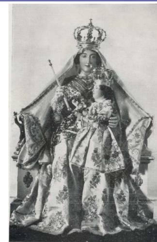
Prodigiosa immagine della Madonna dell'Acqua, Patrona e Regina di Mussolente

Questa la prece a te ausiliatrice, mentre ne ripete il vento: Ave, ave! ave