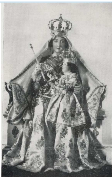
Prodigiosa immagine della Madonna dell'Acqua, Patrona e Regina di Mussolente